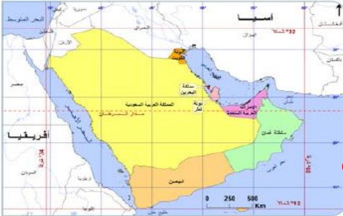
خريطة شبه الجزيرة العربية السياسية

أحدّد على الخريطة التي أمامي دائرة العرض الرئيسية التي تقطع أراضي بعض دول شبه الجزيرة العربية.