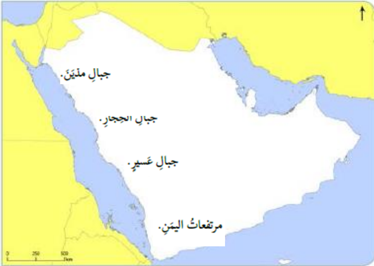
خريطة صقاة لشبه الجزيرة العربية

ألاحظ الخريطة التي أمامي، ثمّ أستخدم مهاراتي الفنيّة في تحديد وتلوين: • جبال مديّن. • جبال الحجاز. • جبال عسير. • مرتفعات اليمن.