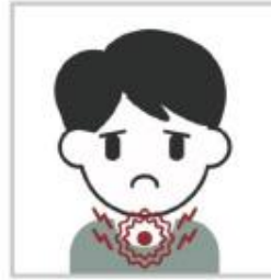
ألم في الحلق