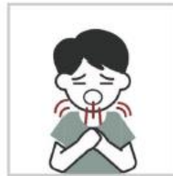
ضيق وصعوبة في التنفس